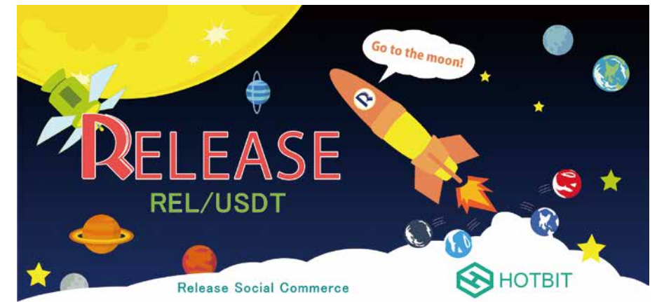
RELトークンが上場する暗号通貨取引所「Hotbit (ホットビット)」に今年2月REL/USDTペアが追加され取引を開始

このソーシャルコマースでは、SNSに登録と投稿したユーザーは、サイト訪問者の閲覧回数によってポイントを得ることができ、貯まったポイントは、独自の暗号資産「REL」を通じ、RELEASEコマースで商品を購入することができる。また、RELは海外暗号通貨取引所に上場しているため、ビットコインやイーサリアムなどの暗号資産と交換することや他社のさまざまなポイントとも交換することが可能になる。つまりソーシャルコマースRELEASEは、「無から有を創り出す」仕組みなのだ。